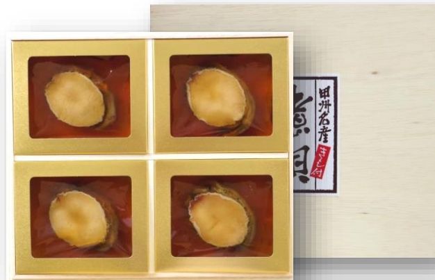
「あわび磯煮 KR-100」 4粒合計260g オーストラリア産