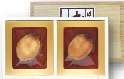
「あわび磯煮 KR-50」 2粒合計120g オーストラリア産

あわびをかいや伝統の製法にてじっくりと煮上げました。肝付きのまま煮上げておりますので、あわびを口に含んだ瞬間、磯の旨味と香りが口いっぱい広がります。