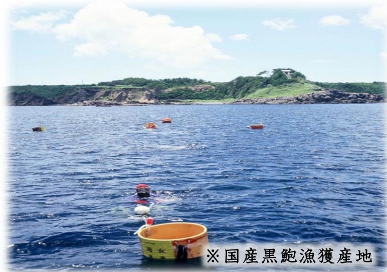
※国産黒鮑漁獲産地

かいやでは、産地から活きたままあわびを入荷する活原料をはじめとして、ボイル冷凍・生冷凍など様々な形態で、煮貝に適したあわびを仕入れています。