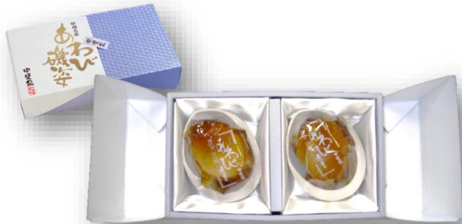
「あわび煮貝 1-80」 2粒合計120g オーストラリア産

じっくりと煮上げた煮貝を、あわびの殻型陶器に乗せ、化粧箱に詰めました。 甲州名産「あわびの煮貝」は、大切な方への贈り物に最適です。