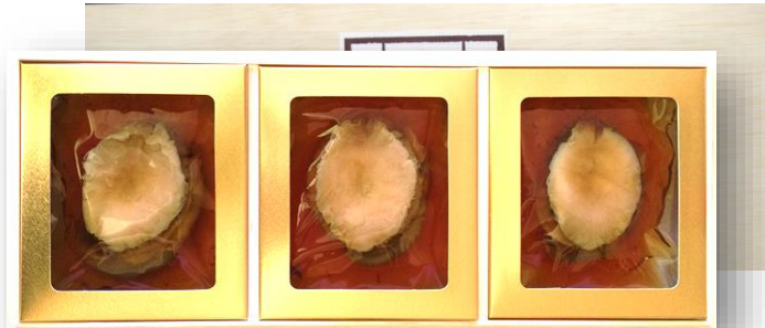
「あわび磯煮 KR-75」 3粒合計190g オーストラリア産