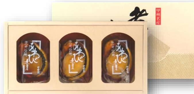
「あわび姿煮 CS-50」 3粒合計150g(殻・肝付き) 千り産