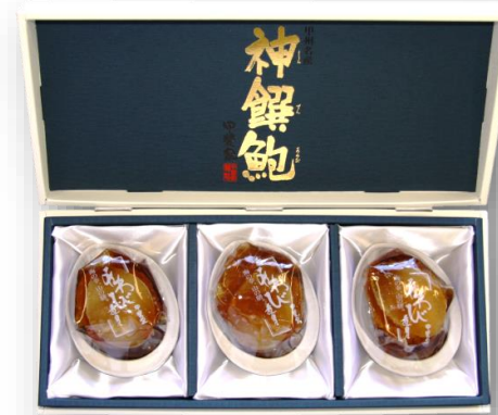
「あわび煮貝 AS-150」 3粒合計210g オーストラリア産