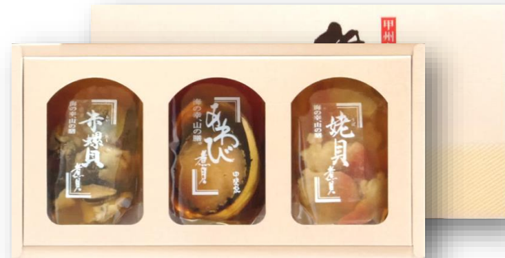
「煮貝詰合せ TK-30」 あわび姿煮50g、味つけアカニシ貝50g、 味つけうば貝50g