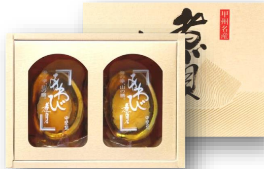
「あわび姿煮 C-30」 2粒合計100g(殻・肝付き) 千り産

あわびを一粒まるごと煮貝に仕立てました。肝付きのまま煮上げておりますので、あわびを口に含んだ瞬間、磯の旨味と香りが口いっぱい広がります。肝は1cm程にカットしますと、酒の肴として非常においしくお召し上がり頂けます。