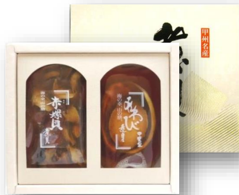
「煮貝詰合せ YS-30」 あわび姿煮70g、味つけアカニシ貝80g

あわびをはじめとした様々な種類の煮貝を詰合せにしました。 それぞれの貝が持つ旨味や食感を食べ比べてみてはいかがでしょうか。