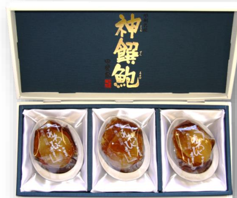
「あわび煮貝 AS-200」 3粒合計300g オーストラリア産