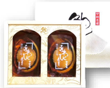
「あわび姿煮 AP-50」 2粒合計140g(殻・肝付き) 千り産